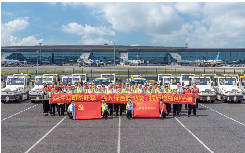
▲南航集团各基层党组织围绕中心工作深化创先争优活动

行和机务这两个重要的安全部门，他们以组织联建、业务联动、队伍联训“三联共建”为抓手，启动“飞行机务技术万里行”，联合成立“空地保安全”工作室，进一步筑牢联防联控保安全防线。