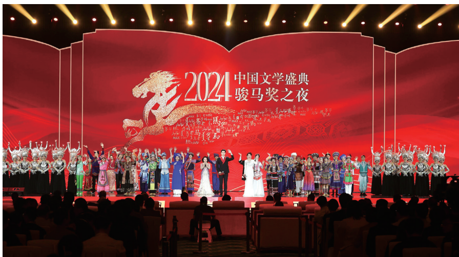
▲“2024中国文学盛典·骏马奖之夜”在广西南宁举行

守道路方向之正，坚持党的全面领导。中国共产党的领导是中国特色社会主义最本质的特征、