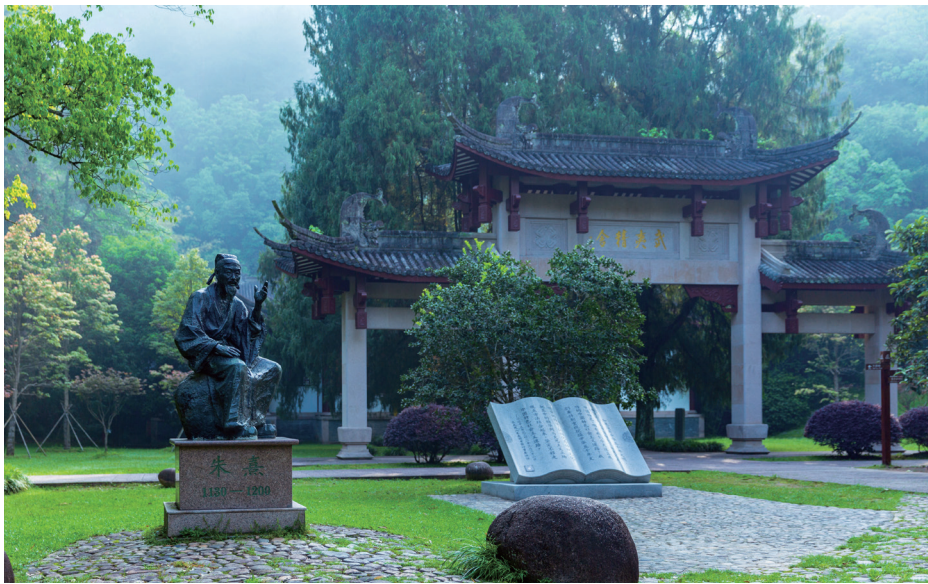
▲福建省武夷山市朱熹园

习、宣传宣讲和研究阐释，推动习近平文化思想落地生根、开花结果。立足福建特色优势，研究制定《新时代福建文化强省建设纲要》，对2024—2035年深入实施中华优秀传统文化传承发展工程、传承弘扬革命文化、加强文物保护利用和非遗保护传承等工作作出整体部署，加强新时代文化建设的顶层设计和方向引领。