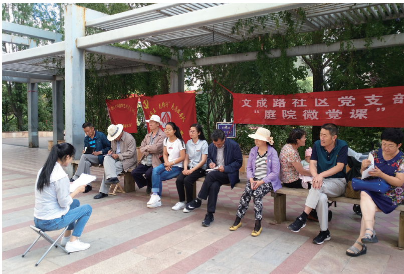
▲文成路社区开展“庭院微党课”

小屏幕，以“不见面”形式组织开展“线上微党课”，让辖区老党员在线上相聚，听党话跟党走。每周开设1~2堂课程，将党的二十大精神、各项最新惠民利民政策等录制成小视频，及时发布在“线上微课堂”的微信群内，鼓励老党员利用微信语音、视频、图片等分享学习心得、开展学习讨论。“线上微课堂”从以往的定时学、集中学，转变为自主学、随时随地学，实现学习的日常化、常态化，满足党员群众的碎片化、个性化学习需求。截至目前，通过“线上微党课”的形式，共发布红色音乐党课30余期、政策宣讲党课14期，视频播放量达几万次，引导社区广大党员发挥模范带头作用，在工作中树立榜样、担当作为。